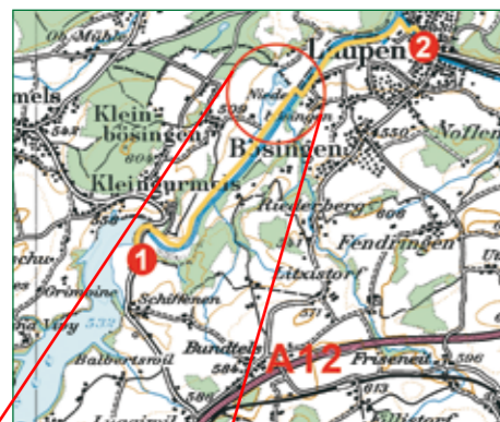
Carte nationale 1:100'000, no 36 (Saane / Sarine)