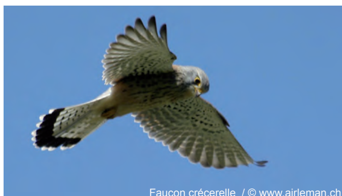
Faucon crécerelle

Cette mesure étant appropriée en zone agricole, elle est proposée aux exploitants participant à un projet de réseau sans être imposée. Ces nichoirs ne sont pas comptabilisés parmi les nichoirs posés sur les arbres.